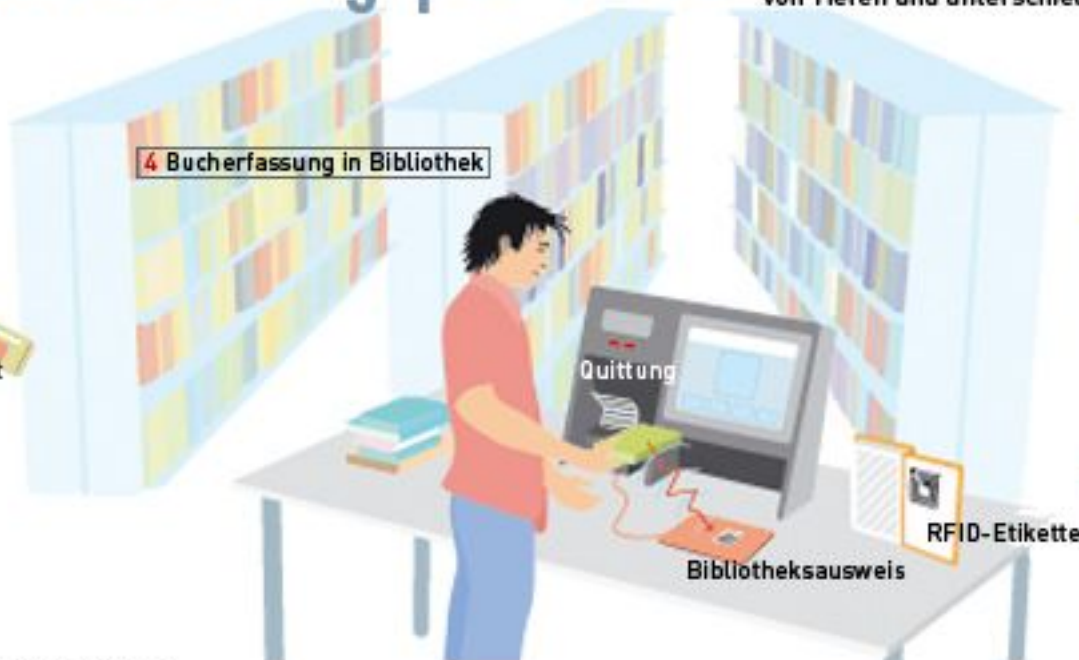
4 Bucherfassung in Bibliothek